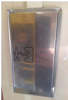
knop binnenkant (links van de deur)

Belangrijk is dat wij niet meer via de deurklink de deur openen. Wilt u hier als ouder ook opletten? Er is een knop aan zowel de buitenkant als de binnenkant.